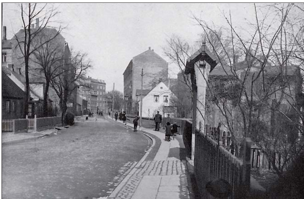
1917 Billedet, set mod øst, er taget på Øresundsvej ud for skolen.

Senere blev skolen også for piger, og da den lukkede i 1985, blev den omdannet til kultur- og pensionistaktiviteter. Fra 1988 blev skolens tidligere gymnastiksal i en snes år brugt af et nyt Røde Kro Teater, hvor ildsjæle forsøgte at genoplive stemningerne fra det rigtige Røde Kro Teater,