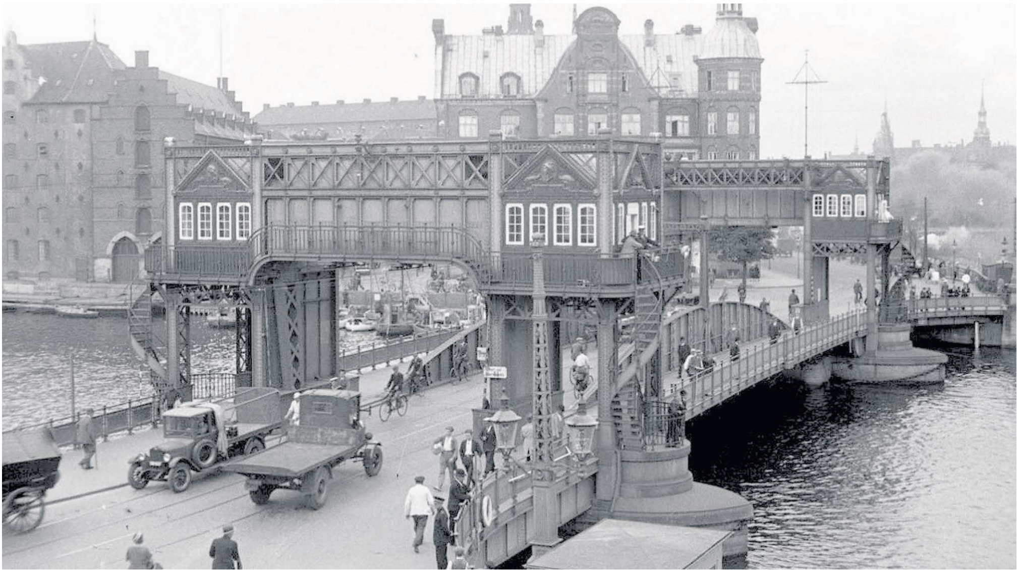
August 1933: Broen fra 1908 set fra Christianshavn mod nordvest.