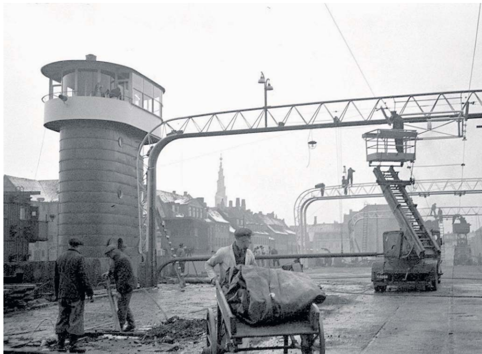
Oktober 1937: Den nye og nuværende bro er ved at være færdig. Til venstre i billedet, bag manden med trækvognen, skimtes husene i den lille Brogade som lå parallelt med Torvegade.

Ofte er det ad og på Knippelsbro at alskens demonstrationer har fundet sted, fordi den ligger tættere ved Christiansborg end Langebro gør. Og mens disse linjer skrives den 19.10.2010, udsender Danmarks Nationalbank en ny