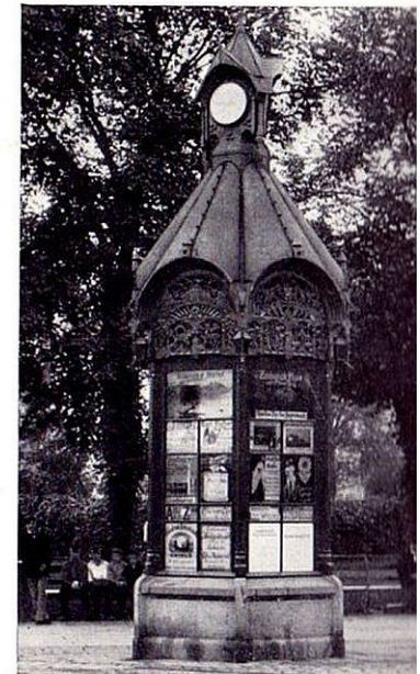
Den første Telefon-Kiosk Kongens Nytorv ved Hesten

Københavns Telefon Kiosker blev hurtigt populære. Der gik ikke lang Tid før de føjede sig ind i Gadebilledet som noget