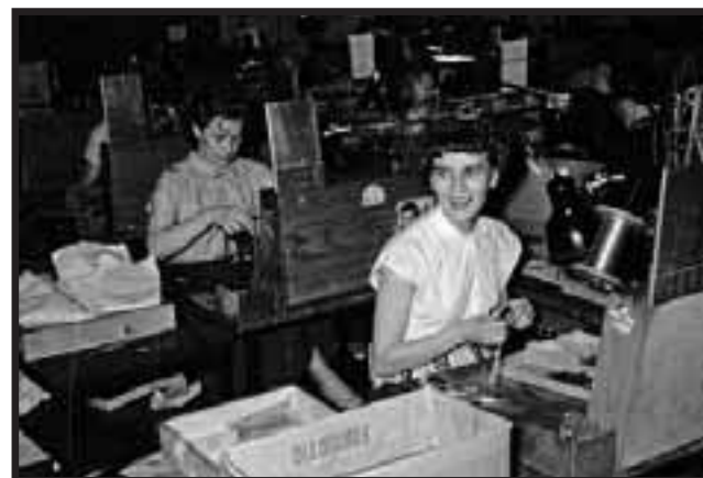
Fra produktionsafdelingen i 50'erne, da den lå på Ved Amagerbanen 23.

skete der fyringer, strukturrændringer og tilpasninger som den slags kaldes.