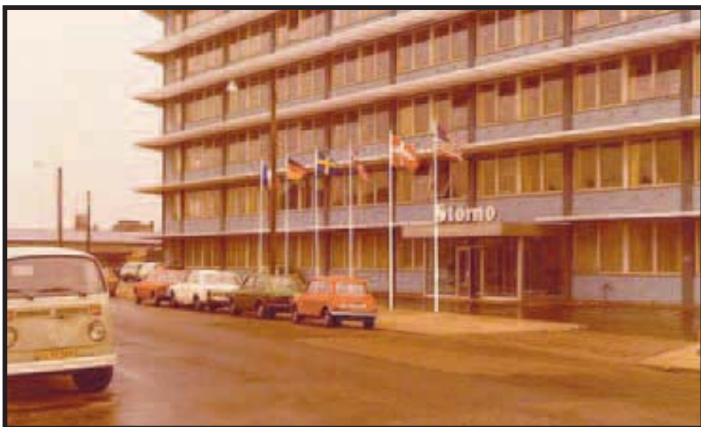
Storno på Artillerivej 126 engang i 70'erne.